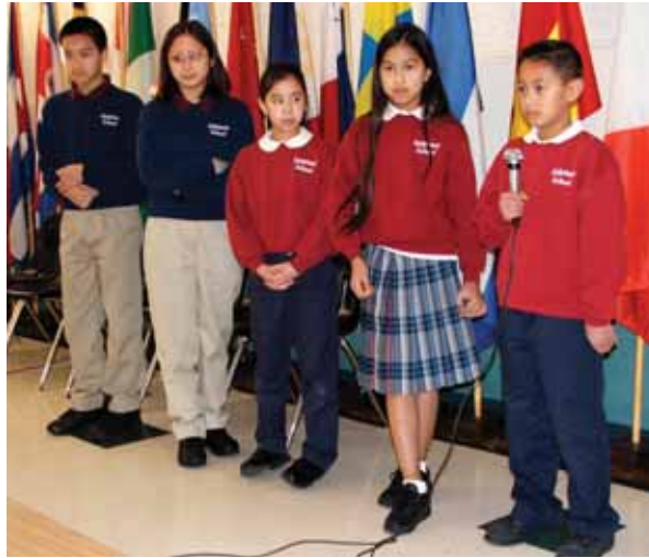
Estudiantes de la escuela Epifanía participan en una competencia de deletreo en la cafetería de la escuela.

Le gusta que los maestros tienen años impartiendo clases en la escuela. La directora y la