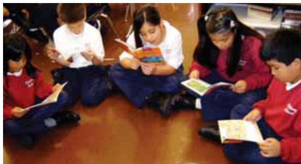
Estudiantes de segundo grado leen en el salón de clases.

subdirectora, más de 40 años. Y hay maestros que llevan más de 25 años.