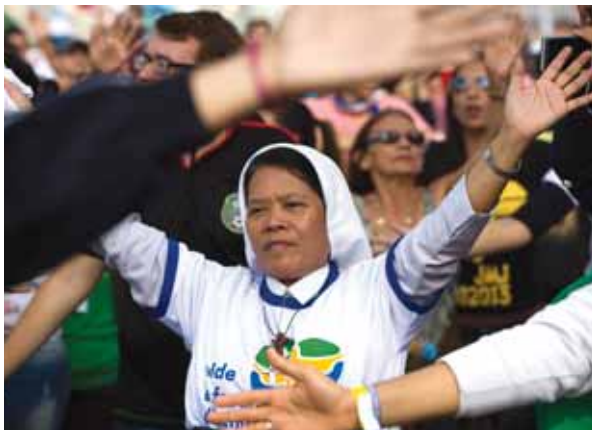
Peregrinos cantan durante la Misa del Día Mundial de la Juventud en la playa de Copacabana en Río el 28 julio.

Uno de los pioneros del movimiento fue el padre jesuita Edward Dougherty, fundador del canal satélite de televisión de Brasil Seculo 21.